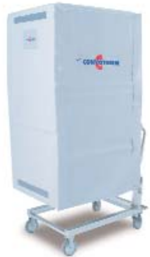
Thermohaube Unersetzlich, vor allem bei vielen G%osten: die Thermohaube h%olt die Speisen bis zu 20 Minuten heifl.