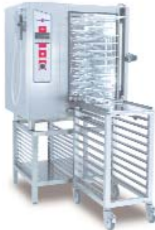
Tellerbankettssystem (Abbildungsbeispiel f, r Tischger%ote) Bis zu 32 Teller mit einem Durchmesser von 32 cm passen leicht in die Modellreihe 10.10 von CONVOTHERM