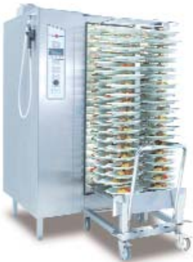
Tellerbankettwagen (Abbildungsbeispiel f, r Modellreihe 20.20) Ob zum K, hlrraum oder zur Ausgabestation ñ der Bankettwagen erleichtert Ihnen den Transport immer und ,berall